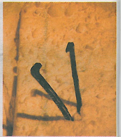
KALOSJER: Husker du? Skøytekalosjene, de som alltid ble borte i snøen i løpet av kvelden...