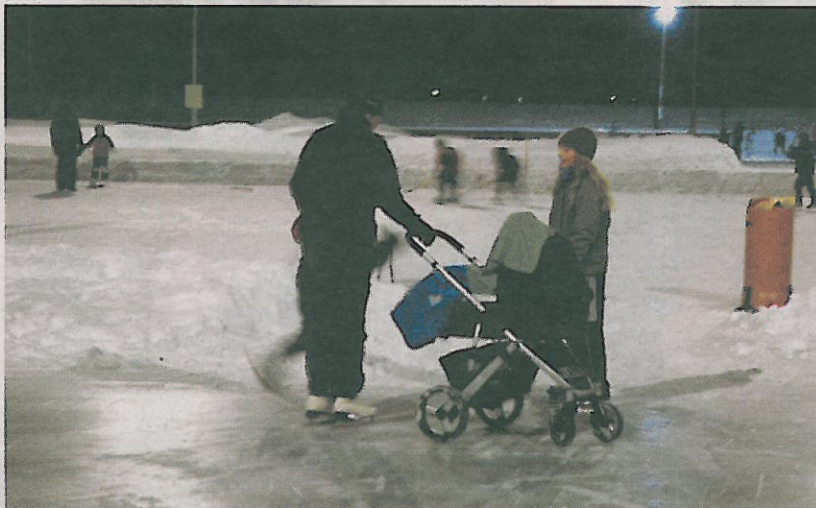
TIDLIG PÅ'N: På Tynset trekker de ungene ut på isen fra de ligger i barnevogn.