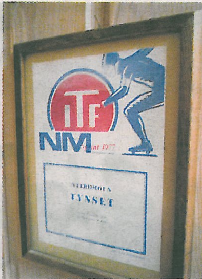
GAMLE DAGER: Det var en tid... Da det var storløp på Nytrømoen.