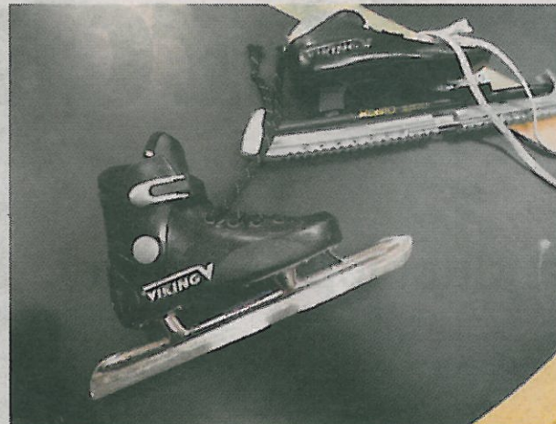
FINE BARNESKØYTER: Stive og varme sko for barn som vil prøve seg på skøytebanen.